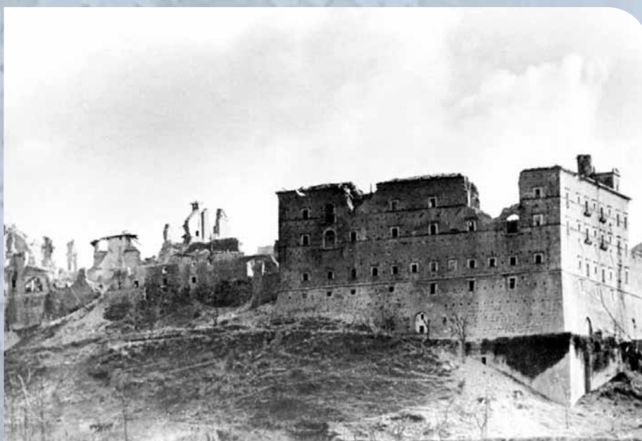
Ruiny klasztoru na Monte Cassino