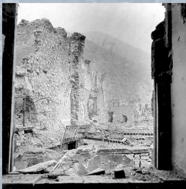
Ruiny miasteczka Cassino w czasie walk

18 maja br. minie 70. rocznica zdobycia przez żołnierzy polskich ruin klasztornych i okolicznych wzgórz na szczycie Monte Cassino, umożliwiającego aliantom marsz drogą nr 6 w kierunku Rzymu. Główny węzeł obrony wojsk niemieckich na Linii Gustawa został przełamany i to wydarzenie okryło chwałą polskiego żołnierza.